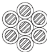
Figura 3 - Formação de Condutores de 7 Fios