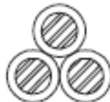
Figura 2 - Formação de Condutores de 3 Fios